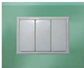
Placca QuBe verde OLTREMARE

Per la placca QuBe Verde Oltremare abbiamo catturato l'immensità degli oceani.